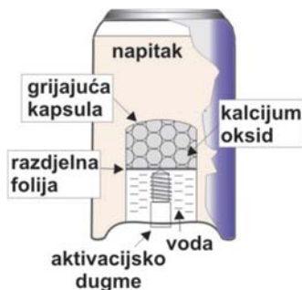
Slika 1.1. Samogrijajuća limenka

Inovacije u pakiranju hrane usmjerena su posljednjih desetak godina na razvoj samogrijajućih ambalaža sa određenim termohemijskim mehanizmima koji podgriju hranu do određene temperature za konzamaciju. Grijanje sadržaja samogrijajuće limenke, u koje se pakiraju: kafa, čaj i supe (Slika 1.1.), se ostvaruje blagim pritiskom prsta na aktivacijsko dugme donjeg dijela limenke pri čemu se izaziva termohemijska reakcija između hemijskih supstanci koje reagiraju egzotermno (npr. kreč i voda) (Steeman, 2012a). Ove supstance moraju biti netoksične i odvojene od hrane pregradom od materijala koji dobro provodi toplinu (Butler, 2008).